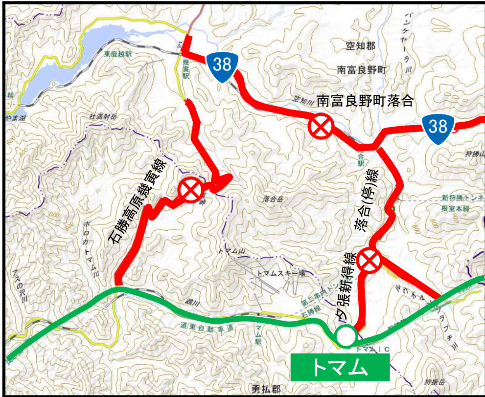
トマムIC付近拡大図