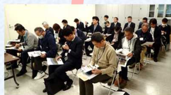
地域のキーマンとの交流 (かわたび交流会)