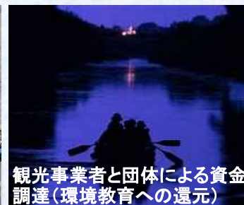
観光事業者と団体による資金 調達(環境教育への還元)