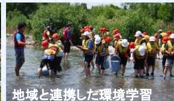
地域と連携した環境学習