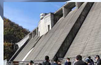
インフラストックを活用した ダム熟成コーヒー販売の試行