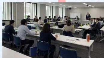
地域の協議会などと連携 (十勝SBW)