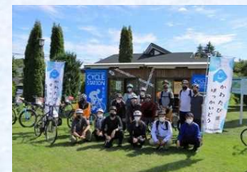
かわまちづくりによる活用(十勝川中流域)