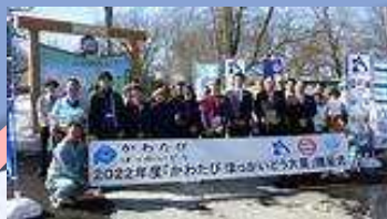
地元企業との新たな繋がり (おびひろ動物園)