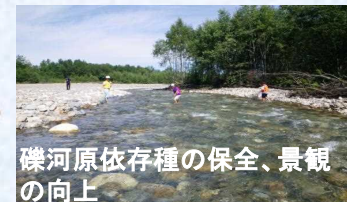
礫河原依存種の保全、景観の向上