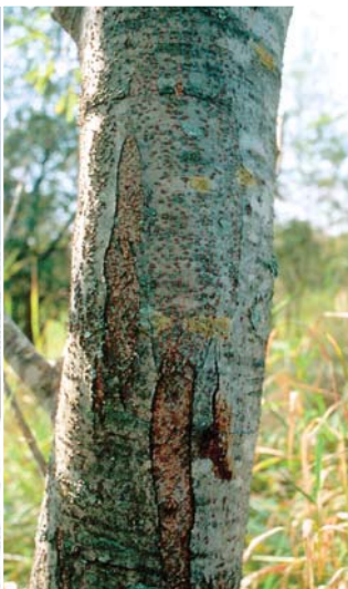
エゾノカワヤナギの樹皮