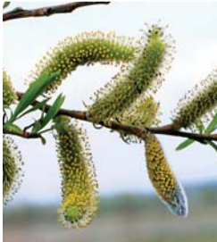
エゾノカワヤナギの雄花

類似種との見分け方：葉が他のヤナギと比べてかなり細く、かなり太くなった幹や枝でも、樹皮がすべすべしている。また樹皮の割れ方が、天然酵母パンの焼き上がり時の裂け方に似ている。