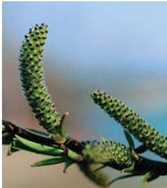
エゾノカワヤナギの雌花