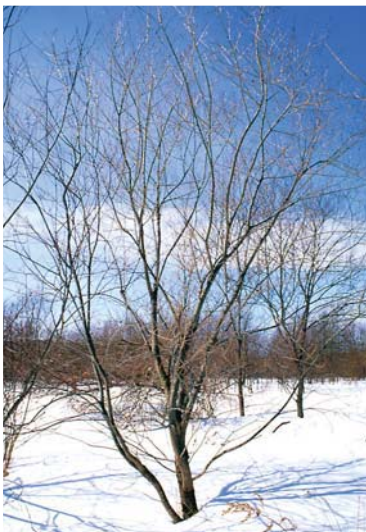
エゾノカワヤナギの樹形（若木）