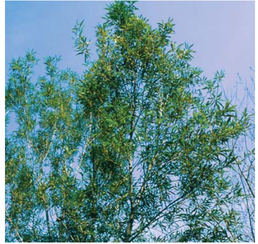
エゾノカワヤナギ