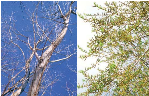
冬のエゾノカワヤナギ

■ヤナギは全体として早熟性であり、発芽後10年ほどで種子散布をおこなう。また風散布によって種子が遠距離まで分散するため、その生育域を短期間に広げる可能性を持ち、「速足の旅人（クイックトラベラー）」と呼ばれるという。