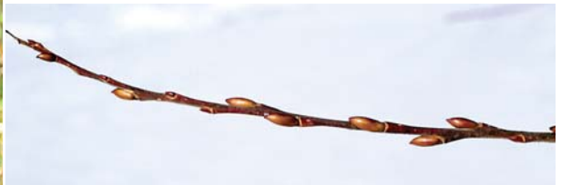
(上) エゾノカワヤナギの枝先 (下) エゾノカワヤナギの冬芽