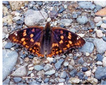
コムラサキ。幼虫時、エゾノカワヤナギなどのヤナギ類を食樹とする