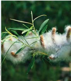
エゾノカワヤナギの実が開き、綿毛と種が出る