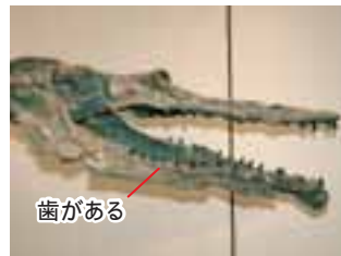
歯のあるヒゲクジラの仲間(カズハヒゲクジラ・約2,500万年前)。