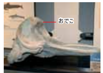
今生きているアカボウクジラ(ハクジラの仲間)。