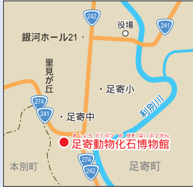
足寄動物化石博物館の位置。足寄町郊南1丁目。

また、展示解説や化石のお話しなどをしてもらうことができ、レプリカ（化石の模型）を作ったりレプリカに色をぬったりするなど、作業の体験もできます。