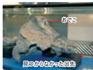
足寄のアカボウクジラ(ハクジラの仲間・約2,500万年前)。