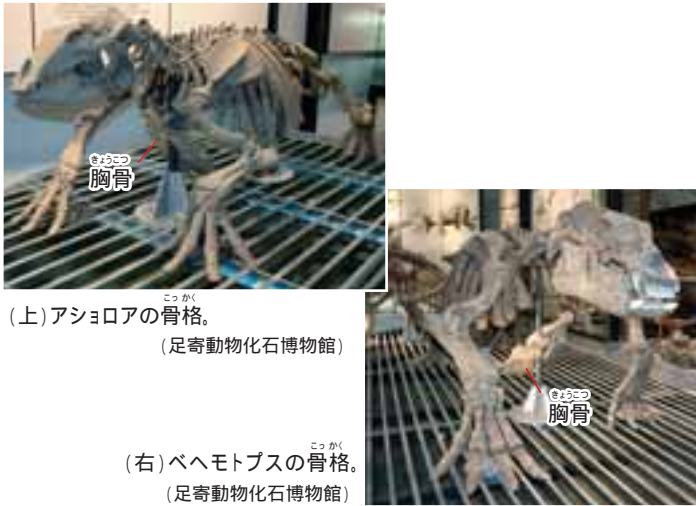
(上)アショロアの骨格。 (足寄動物化石博物館)