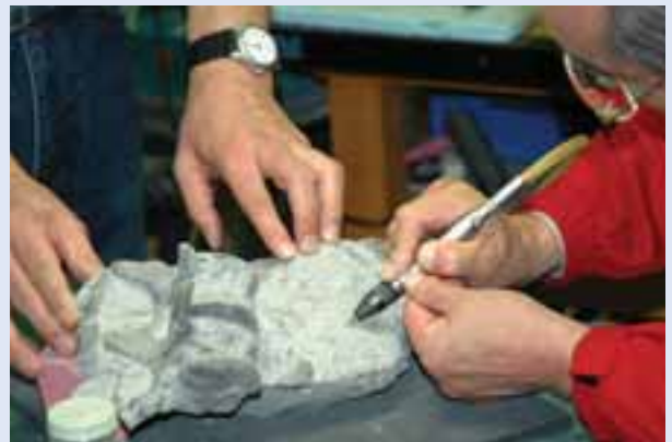
化石と岩石を分ける「クリーニング」作業の体験。