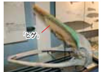
今生きているヒゲクジラ(ミンククジラ)。「ヒゲ」はあるが、歯はない。