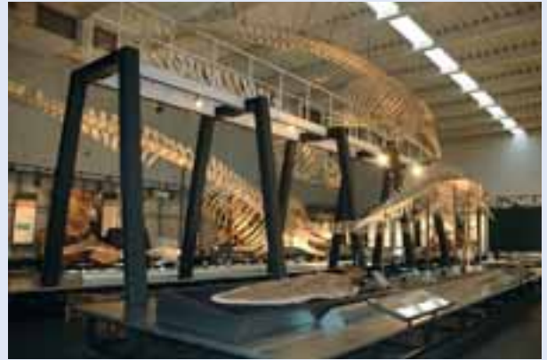
足寄動物化石博物館の展示室。大きなクジラの骨格に目をうばわれる。