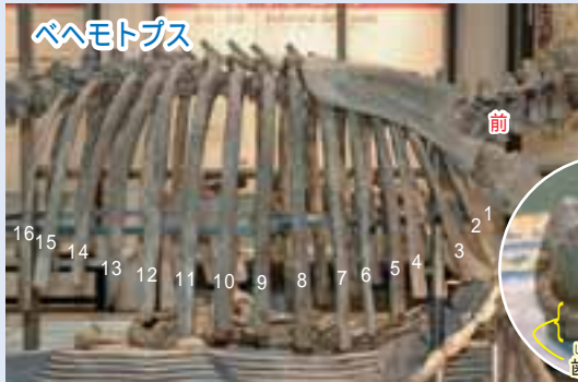
アショロアとベヘモトプスの肋骨。数がちがう。円内はそれぞれの臼歯（おく歯）の複製。ベヘモトプスには「歯帯」がある。