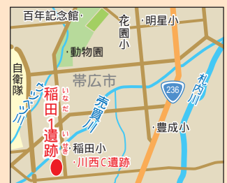
稲田1遺跡の位置。帯広市西16・17条南40・41丁目。