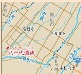
八千代遺跡の位置。帯広市八千代町。