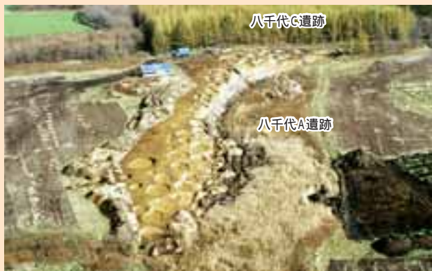
発掘された時の八千代A遺跡の全景。おくの林の中に八千代C遺跡。