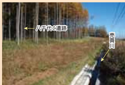
発掘されていない八千代C遺跡。林の中の丘にある。右手前の細い水路が売買川上流部。