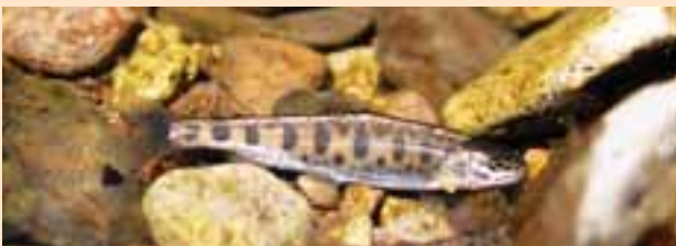
サケの仲間であるヤマメ。ただし、土器の文様の魚がヤマメだったかどうかまではわかっていない。

帯広市の稲田小学校の西向かいには、「稲田の森」と呼ばれるカシワなどの林があり、そこから北へ坂を下りると売買川の流れています。