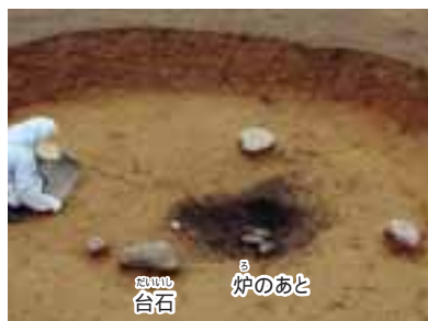
八千代遺跡の「炉」のあと、住居あとの床にあった。