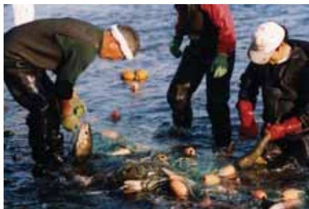
以前、十勝川でおこなわれていた網によるサケ漁(採卵用)。平成8年(1996)の写真。