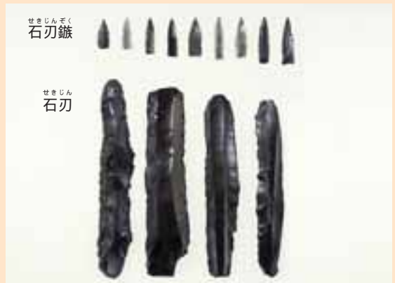
大正遺跡(帯広市)で見つかった石刃鎌というヤジリと石刃。