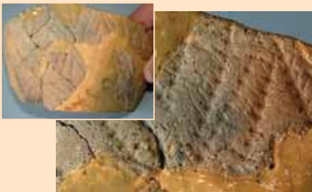
稲田1遺跡で見つかった土器とその表面にあった魚の骨による文様。