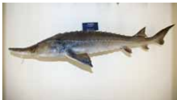
チョウザメ。十勝川には昭和時代なかばまでいたという。 (浦幌町立博物館：4)

めむろちよう にししかり いせき 芽室町の西土狩4遺跡（およそ6,000年前）では、サケ（？）、イトウ、ウグイの仲間とともにチョウザメの骨が見つかりました。