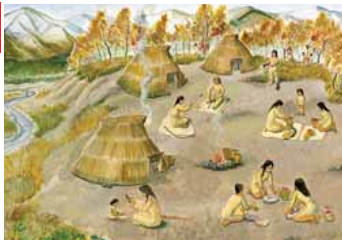
八千代にあった縄文時代の集落の想像図。