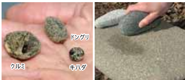
八千代遺跡で見つかった木の实。 八千代遺跡のすり石と台石。

そのほか、ヤマブドウやコクワ(サルナシ)といった、野生のくだものも、食事を豊かにしました。