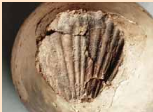
土器底のホタテ貝のカロのあと。