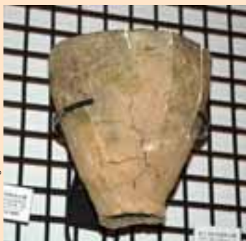
(右)八千代遺跡の土器。底にホタテ貝のカロのあとがついている。(帯広百年記念館)