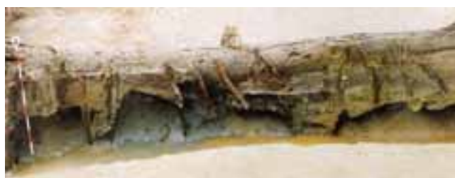
もみじやま ごういせき いしかりし 紅葉山49号遺跡（石狩市）で見つかったエリのあと。木のくいが一列にならんでいる。

残念ながら、こうしたあとは十勝では見つかりません（木の道具はふつつくさってしまう）が、同じ方法で漁がおこなわれていたのかも知れません。