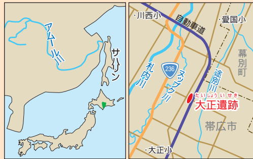
アムール川とサハリン。大正遺跡。帯広市大正町。

およそ7,500年前、アムール川の人たちが、サハリンを通り海をわたって、途別川や浦幌川までやって来ていたのでしょうか。