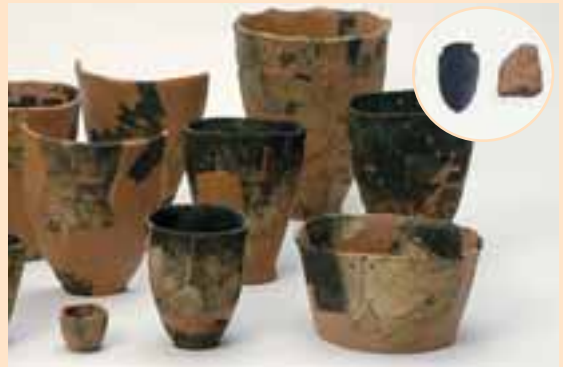
大正遺跡(帯広市)で見つかった、石刃鎌を使う文化の土器。日本の縄文土器的ではない。円内はペンダントと顔料のもと。