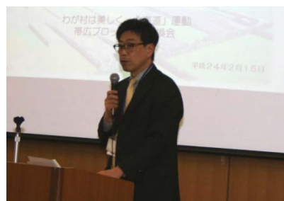
帯広市小野副主幹

「ワールド・カフェ」方式のワークショップでは、4～5人ずつ6グループに分かれ、「とかちの魅力」をテーマに話し合い、25分間のラウンドごとにメンバーチェンジをして3回のラウンドを行いました。自分たちの活動を紹介しながら、地域の魅力や十勝の特色などについて意見を出し合い、机に広げた模造紙に意見やキーワードなどを次々と書き込んでいきました。