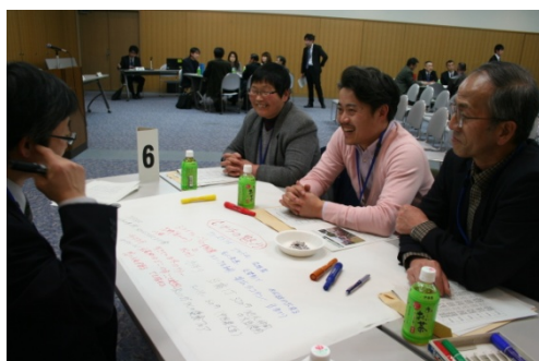
リラックスした雰囲気に自然と会話も弾みます