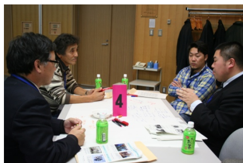
農業・商業・行政など、様々な立場から意見が出されました