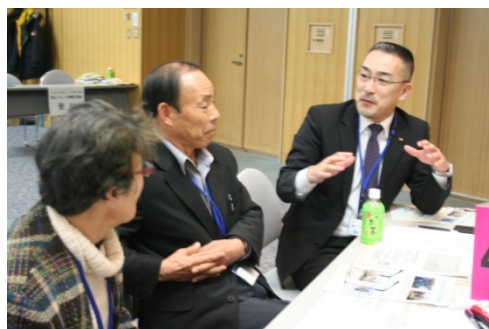
とかちの魅力を熱く語る参加者

「昨年の会での交流がきっかけとなって一緒にイベントに参加した」という団体もあり、今後もこのような情報交換会を継続的に開催して、団体間の交流の場を提供していく必要性を感じました。