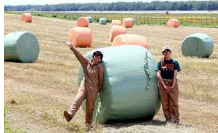
空港滑走路の隣に現れたカラフルな牧草ロール