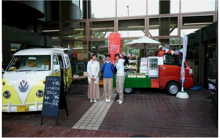
とから帯広空港マルシェ