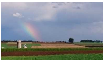
以平地区の農村景観

農業と観光、加工、アパレル分野等の連携により、農業のブランド化と新たなビジネス創出を実現すべく活動範囲を広げています。