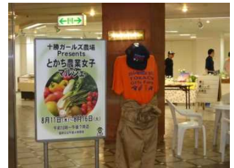
とから農業女子マルシェ

地元百貨店での「とから農業女子マルシェ」の開催をきっかけに、野菜売り場に農産物販売コーナーを開設、東京での物産展に参加するなど、積極的に活動範囲を広げています。