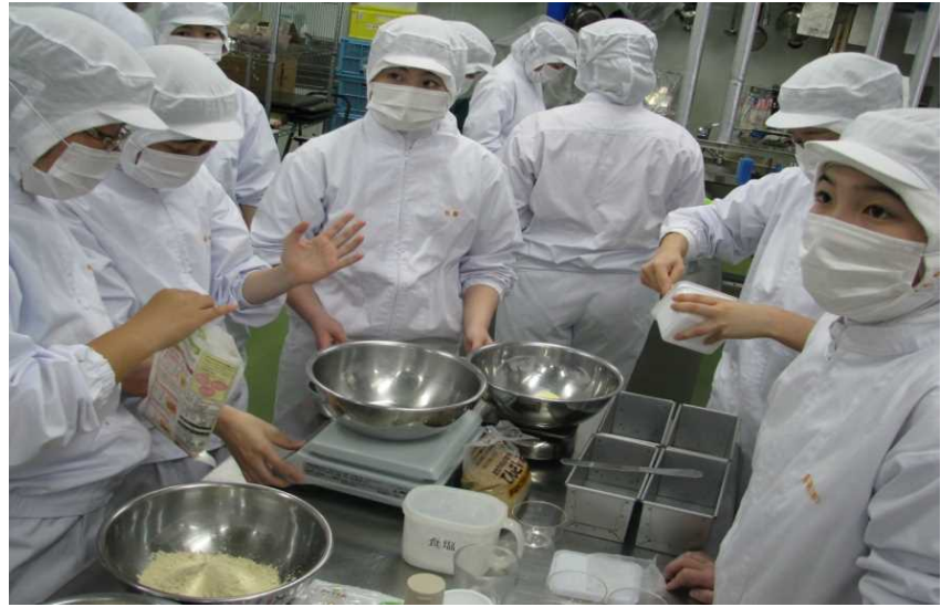
ショートブレッドの調理