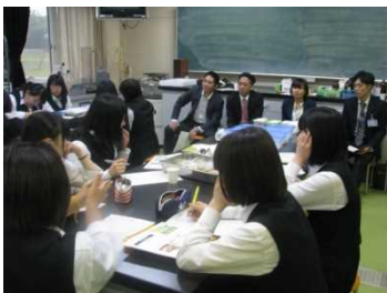
企業や関係団体との打合せ

フードバレーとかち推進協議会、食ラボとかち、(株)フジッコをはじめとする企業・関係団体と連携し、ピニトールを含む機能性食品「P-CUBE（ピーキューブ）」を開発しました。きな粉とクルミのショートブレッドで、1袋6個入りのキューブとしてパッケージしています。