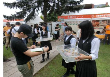
「とかちマルシェ」でのアンケートの様子

「とかちマルシェ」などの市民を対象としたイベントで、P-CUBEの試食とアンケートを行い、「美味しい」「食べやすい」と好評でした。従来は廃棄されていたものを有効活用することは、環境面からも重要です。十勝産の原材料を生かした地域特産物として商品化を進めていきます。