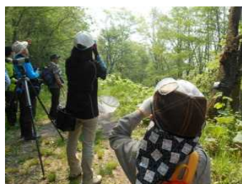
芽室町国見山自然観察会