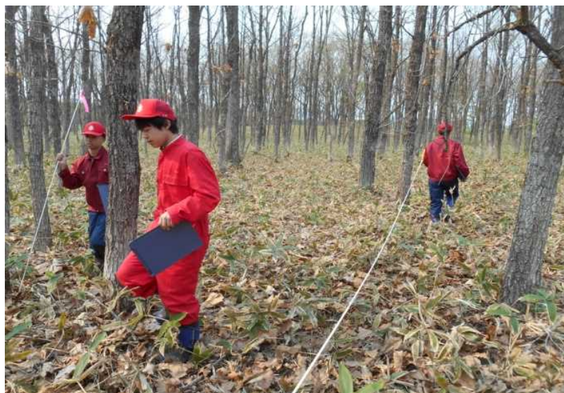
カシワ林の群落組成調査