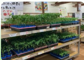
地域に愛されるファーマーズマーケットへ