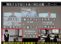
連携企業等との会議