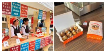
サンタのつぶやきの販売