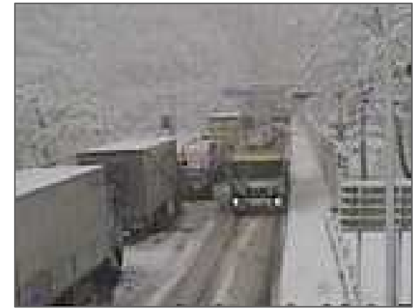
仁木町稲穂峠の冬期渋滞(国道5号)