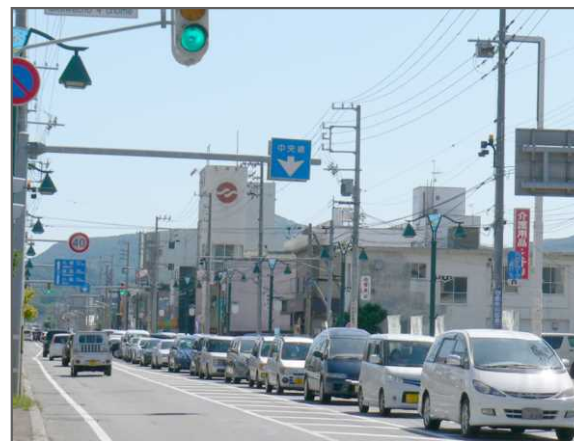
余市町市街の夏期渋滞(国道5号)