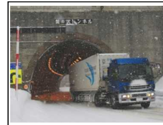
写真1: 国際コンテナ通行支障トンネル (盤の沢トンネル)