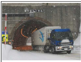
写真1：国際コンテナ通行支障トンネル（盤の沢トンネル）

国際コンテナ通行支障区間の解消により、函館方面と札幌・後志地方を結びリダンダンシーの向上に寄与。