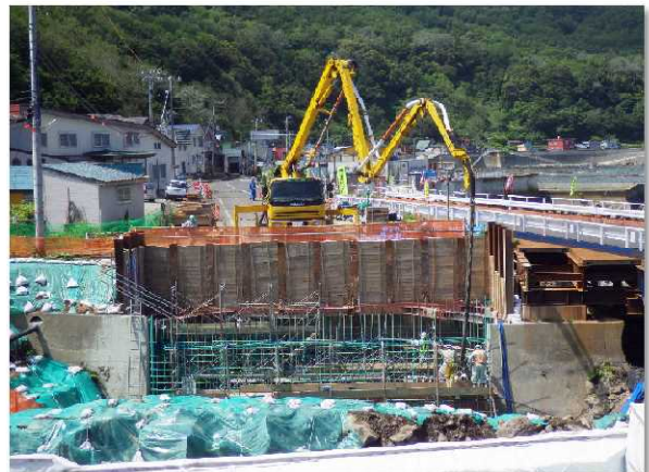
【下部工（A2橋台）のコンクリート打設】