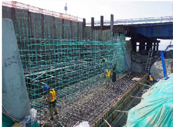
【下部工（A2橋台）の鉄筋組立状況】