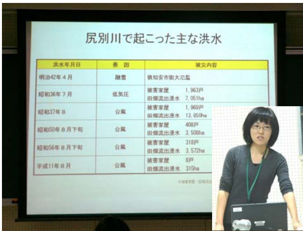
パワーポイントを使って説明