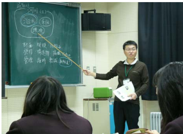
河川法をわかりやすく簡潔に黒板を使って解説