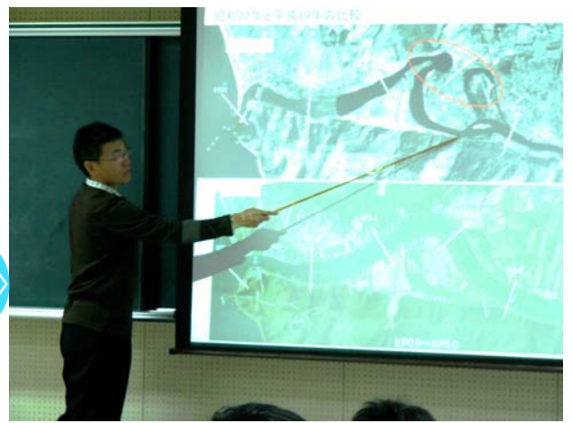
説明に合わせて図示、尻別川の整備前の姿です