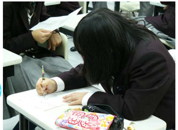
懐かしいですね、ノートを取る生徒