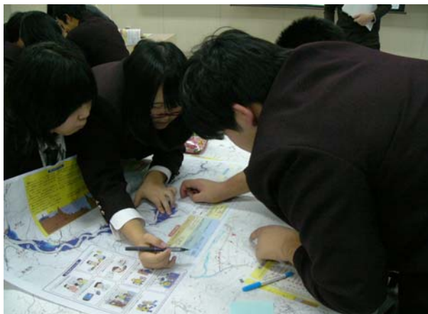
ハザードマップで災害図上訓練です