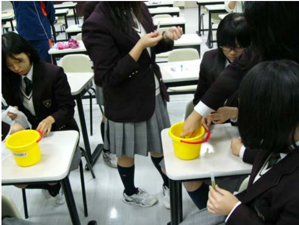
試験薬を使って水質調査体験です