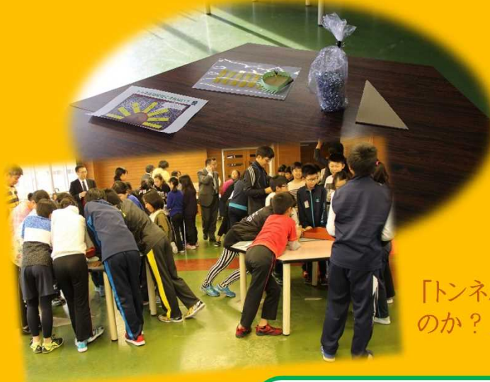
「トンネルはなぜ崩れないのか？」実験しました。