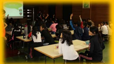
講師からの質問に元気よく手を挙げる児童たち。