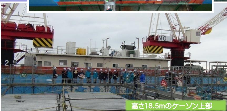
高さ18.5mのケーソン上部