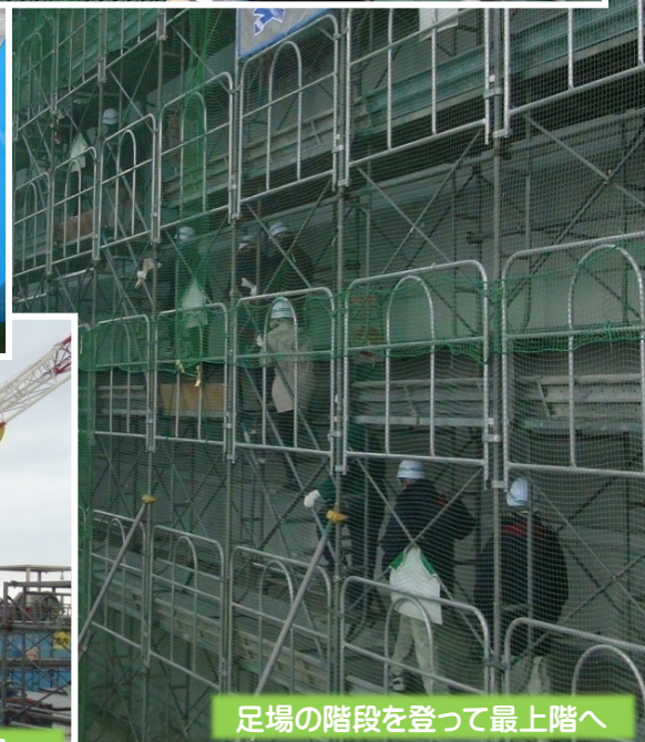
足場の階段を登って最上階へ