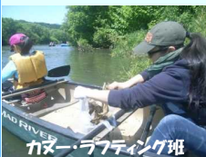
カヌー・ラフティング班