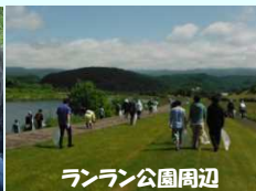
ランラン公園周辺