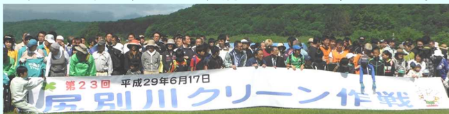
約330名が尻別川に集結

蘭越町や札幌など町内外を含め約330人が参加し、河口から豊国橋までの約23km区間で、5班(ランラン公園周辺、目名川橋下流周辺、御成橋周辺、港地区周辺、カヌー・ラフティング班)に分かれて尻別川のごみを集めました。