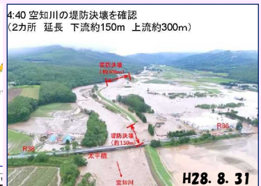
4:40 空知川の堤防決壊を確認 (2カ所 延長 下流約150m 上流約300m) H28. 8. 31 空知川(南富良野町幾野地区)の堤防決壊 市街地や農地が浸水し甚大な被害発生