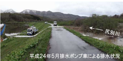
平成24年5月排水ポンプ車による排水状況

今冬については、昨季と比較して尻別川流域では積雪量が多くなっています。例年、尻別川ではゴールデンウィークの前後に融雪による洪水のピークを迎え、5月中は常に水位の高い状態が続きます。融雪出水に降雨が伴うと、より一層水位が上昇します。 増水した川や水路は、見た目以上に流れが速く危険ですので、絶対に近づかないようにしましょう。