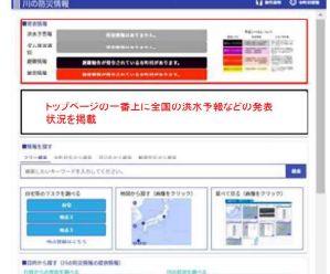
トップページの一画面上に全国の洪水予報などの発表状況を掲載

自宅や職場などの場所(最大3箇所)や確認が必要な観測所などを登録し、トップ画面や地図画面などをカスタマイズし、必要な情報を速やかに確認できるようになります。