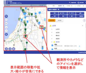
表示範囲の移動や拡大・縮小が容易にできる 観測所やカメラなどのアイコンを選択して情報を表示