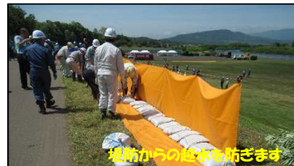
改良積み土のう工の設置状況