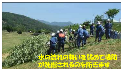
木流し工の設置状況