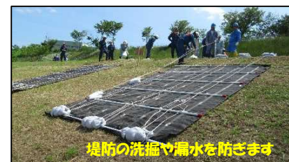
シート張り工の設置状況