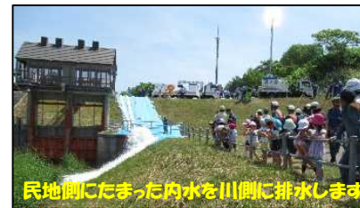
排水ポンプ車訓練