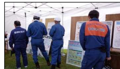
水防災パネル展示