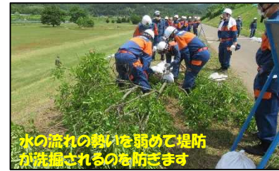
木流し工の設置状況