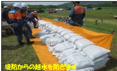
改良積み土のう工の設置状況