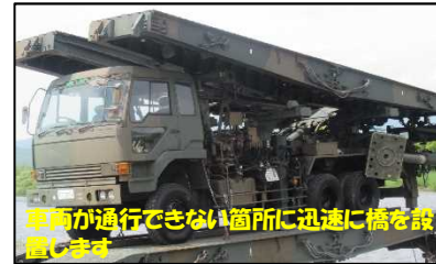
自走架柱橋の訓練展示