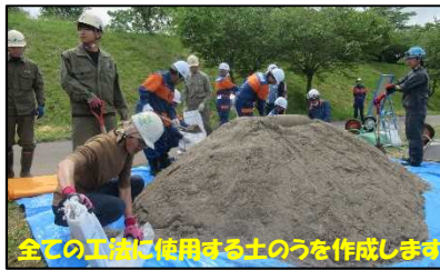
土のう作り工の作業状況