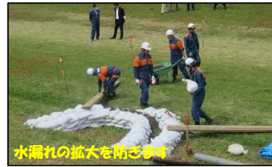
月の輪工の設置状況