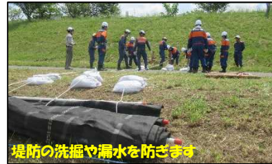
シート張り工の設置状況