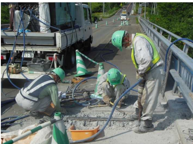
伸縮装置の補修状況