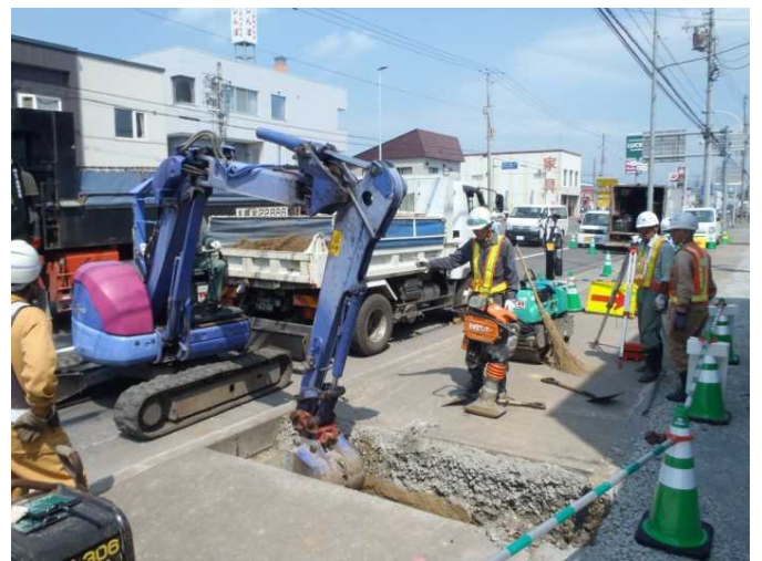
地下埋設物の試掘確認状況