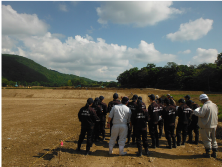
整備実施中のほ場見学