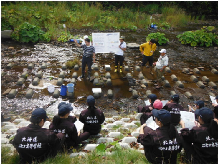
水質調査方法の説明