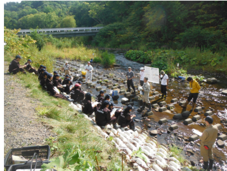
ルベシベ川での環境調査