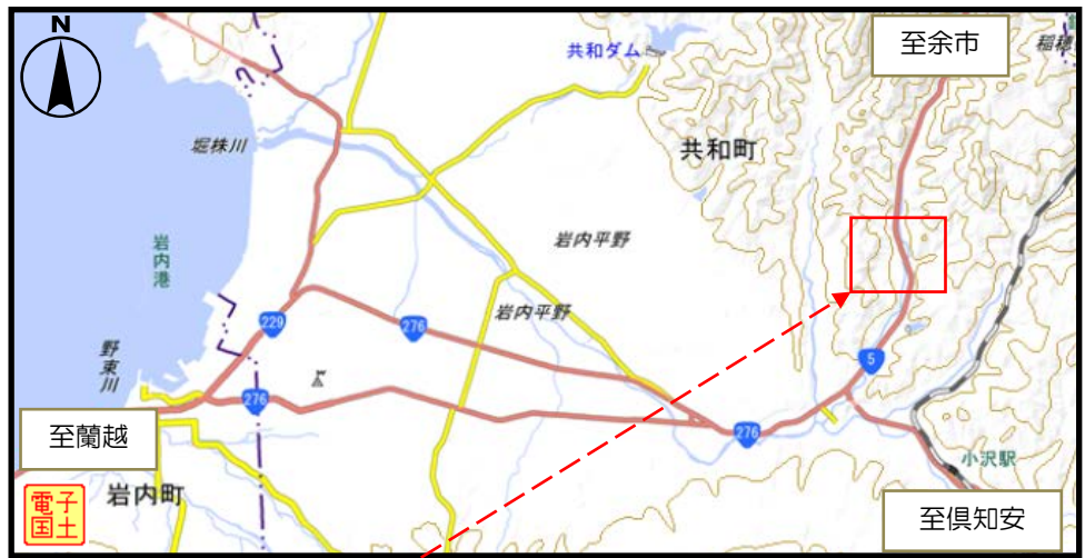
駐車場箇所図（トンネル終点側(国道5号側)坑口）