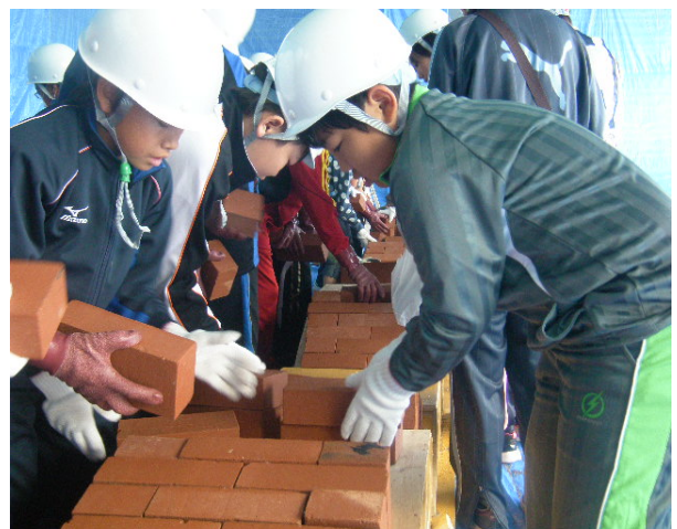
レンガでの橋造り体験