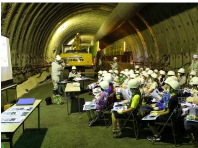
トンネル工事現場見学