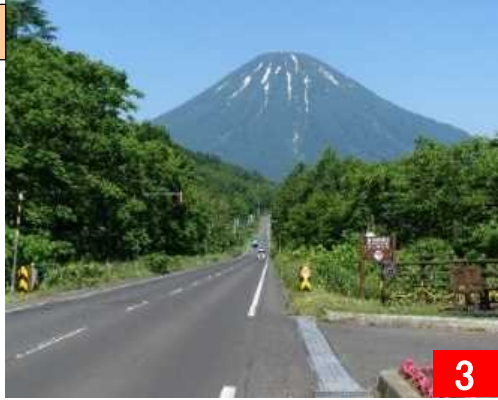
支笏洞爺ニセコルート（ニセコ羊蹄エリア） 美しく変化する羊蹄山の稜線に寄り添う道 （倶知安町・京極町・喜茂別町）