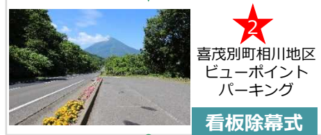
喜茂別町相川地区 ビューポイント パーキング