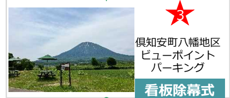
倶知安町八幡地区 ビューポイント パーキング