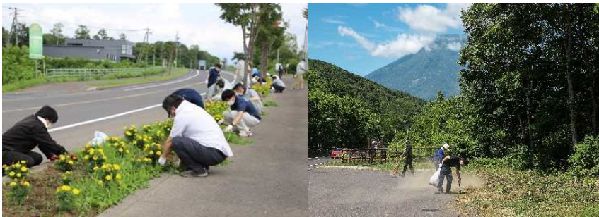
八幡ビューポイントパーキング