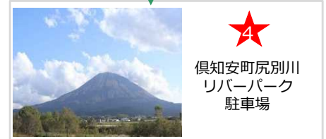
倶知安町尻別川 リバーパーク 駐車場