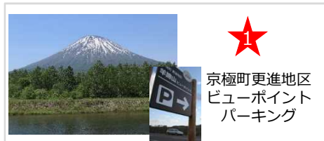
京極町更進地区 ビューポイント パーキング