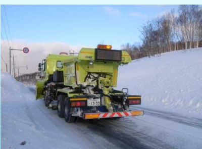
<凍結防止剤散布車>

凍結防止剤散布車により、交差点部などのツルツル路面において凍結防止剤（塩化ナトリウム等）や防滑材（砂）を散布します。