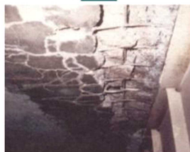
●橋が壊れている様子。