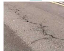
●舗装のひび割れの様子。