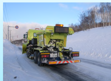
<凍結防止剤散布車>

氷板や圧雪アイスバーンなどのツルツル路面が発生する場合、凍結防止剤などを散布してツルツル路面の解消を図ります。凍結防止剤散布車により、交差点部などのツルツル路面において凍結防止剤（塩化ナトリウム等）や防滑材（砂）を散布します。