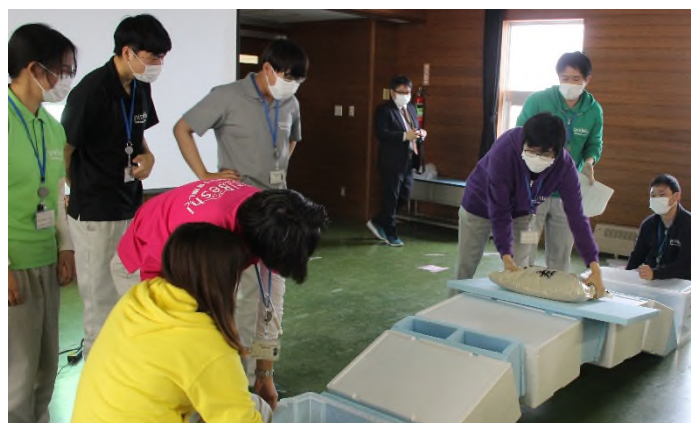
昨年度（令和4年度）開催状況