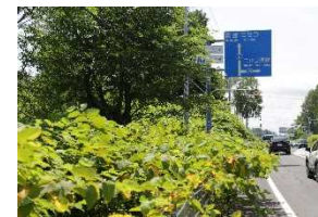
作業前(国道5号地点①)