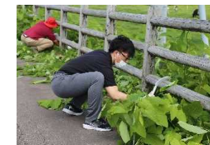
地点②の草刈り作業の様子