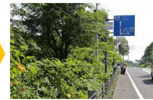
作業後(国道5号地点①)