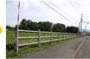
作業後(国道5号地点②)