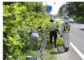
地点①の草刈り作業の様子