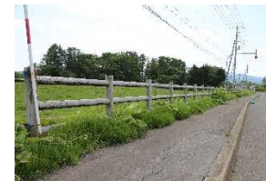
作業前(国道5号地点②)