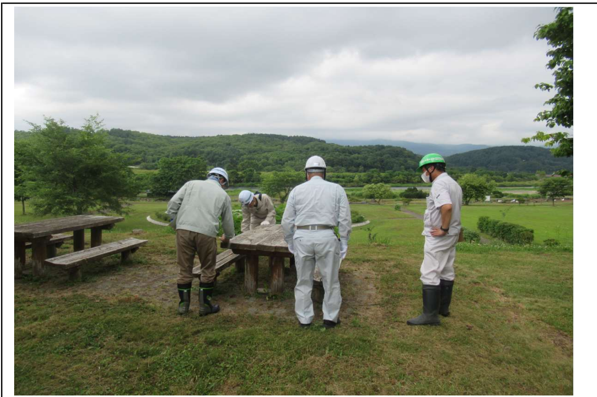
○撮影場所：蘭越地区(ランラン公園)