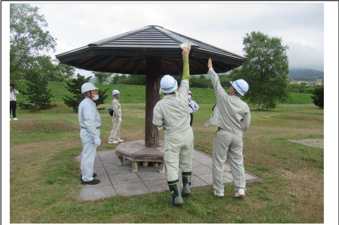
○撮影場所：蘭越地区(ランラン公園)