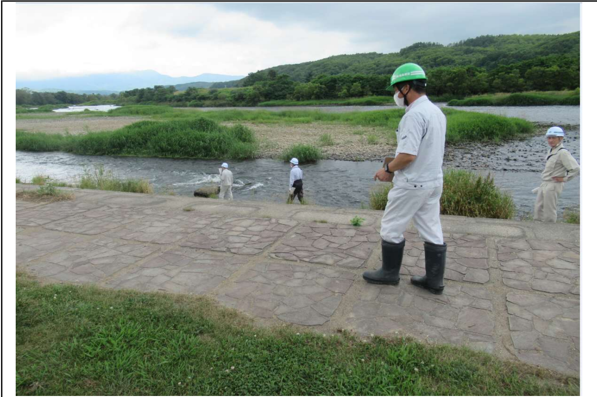
○撮影場所：蘭越地区(ランラン公園)