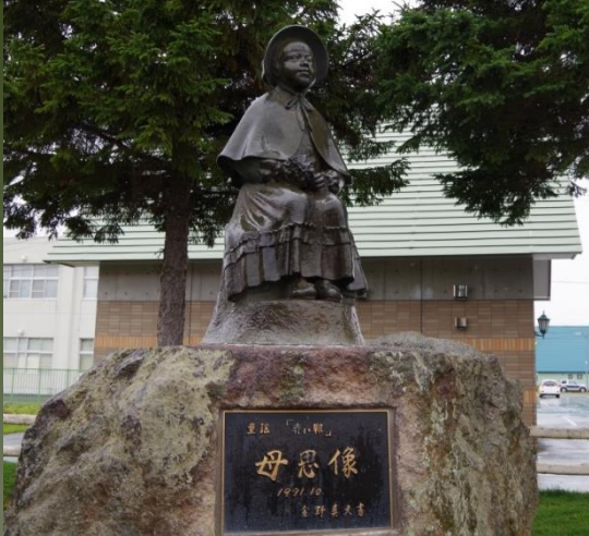
⑧童謡 「赤い靴」 母思像