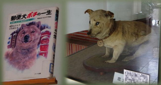
⑦ 真狩村公民館「忠犬ポチ」