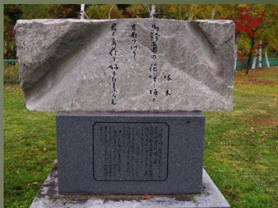
②旭ヶ丘公園 中央広場「石川啄木歌碑」

横にある建立要旨にはこう書かれています。当時の俱知安は電灯もありませんでした。降り立ったのは深夜。真っ暗な俱知安駅で先を急ぐ女性の姿に影を感じ、そこに流浪の身である自分自身を重ね合わせたのかもかもしれません。