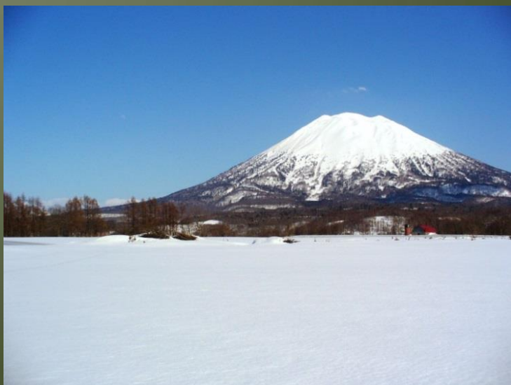
3月。春を待つ羊蹄山。

昆布岳の斜面に小さく集った雲の塊を眼がけて日は沈みかかっていた。草原の上には一本の樹木も生えていなかった。心細いほど真直な一筋道を、彼れと彼れの妻だけが、よろよろと歩く二本の立木のように動いて行った。」