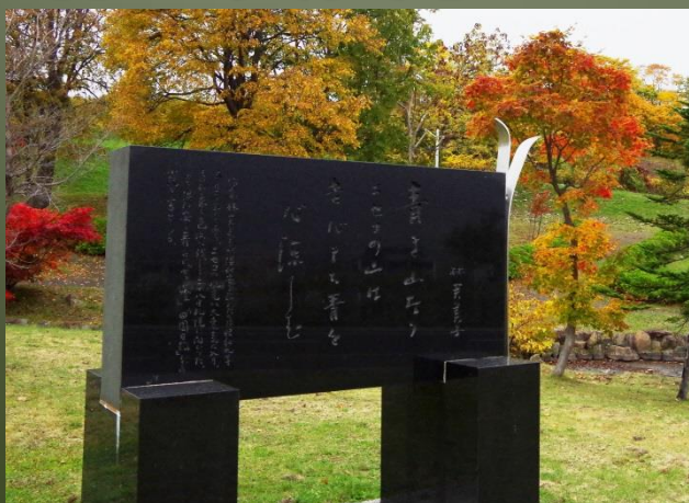
③ひらふ高原中央公園 林美美子文学碑

まずは、小樽市内編でも登場した石川啄木から。俱知安駅の右手、交番の前に歌碑があります。