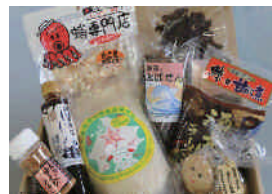
6 駅制覇の賞品 (5名様)

シーニックバイウェイ北海道「萌える天北オロロンルート」は、留萌管内の6「道の駅」と連携して『道の駅スタンプラリー2012』を6月30日～9月30日まで開催しました。応募者総数は2378名にのぼり、このうち抽選で当選した35名の方に留萌管内の特産品セットが贈られました。