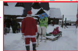
☆トナカイそりはサンタさんと一緒にです