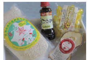
4 駅巡りの賞品 (30名様)