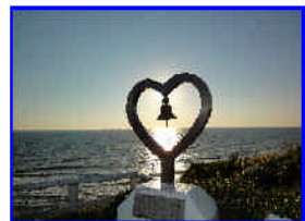
夫婦愛の鐘 (苫前町)