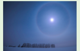
大雪・富良野ルート内で撮影【月輪の夜】

シーニックバイウェイ北海道「宗谷シーニックバイウェイ」「萌える天北オロロンルート」「大雪・富良野ルート」「天塩川シーニックバイウェイ」の、道北4ルートが連携したフォトコンテストを実施致します。上記の2ルート以上で撮影した作品をお送り下さい。(平成30年に撮影したもの) 入賞された方の作品は、大伸ばし写真パネルを作成し、パネル展等を実施します。尚、グランプリに選ばれた方には各ルートの地域特産品、合計2万円相当をプレゼント致します!!