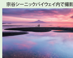
宗谷シーニックバイウェイ内で撮影【夕焼けリフレクション】