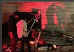
臨場感あふれる災害現場