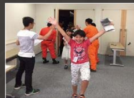
安全確保!脱出成功!!