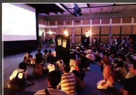
巨大スクリーンの映像演出 BGMと映像で臨場感アップ!