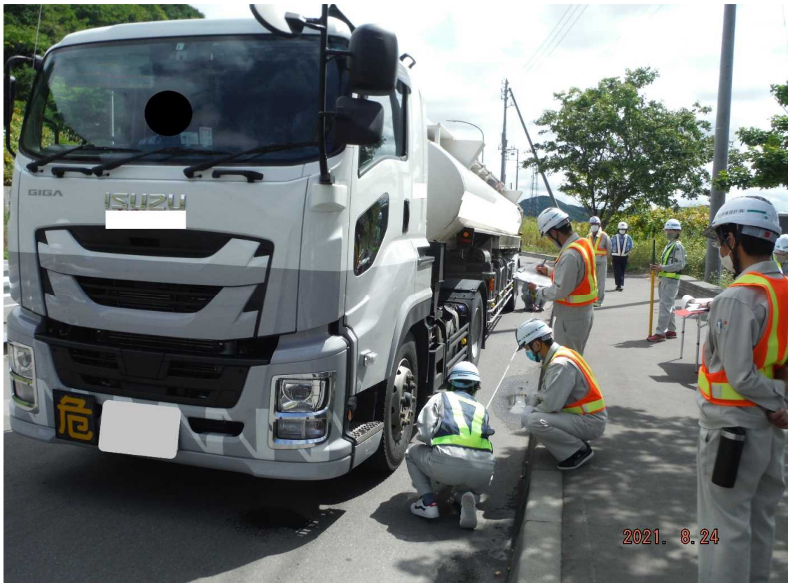
車両諸元(長さ)の計測