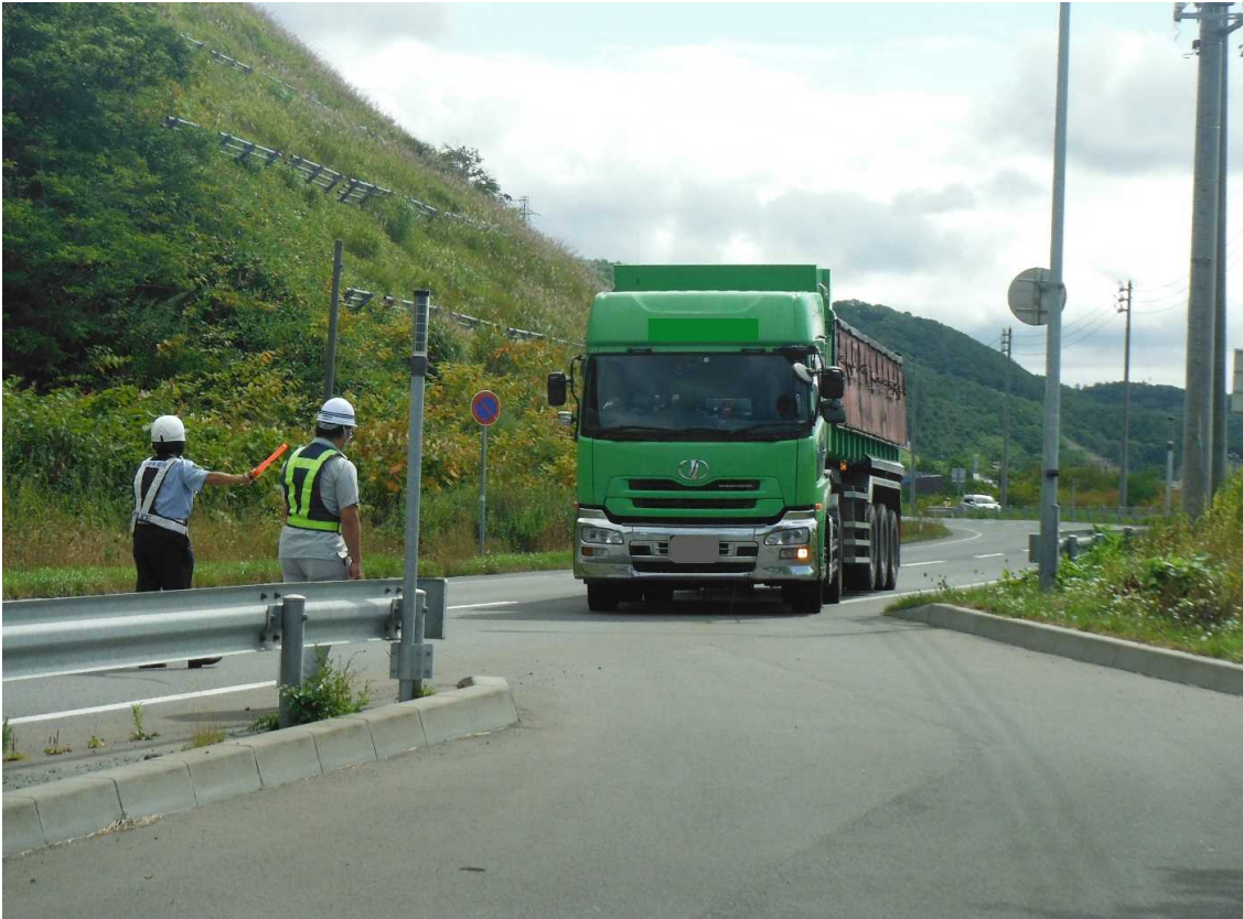
特殊車両の引き込み