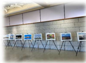
2025年8月5日～8月17日 丘のまち交流館bi.yell