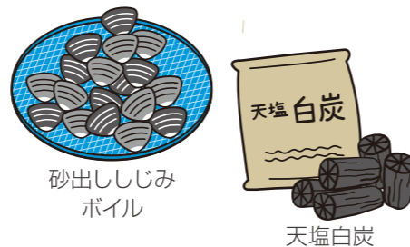
砂出ししじみ ボイル