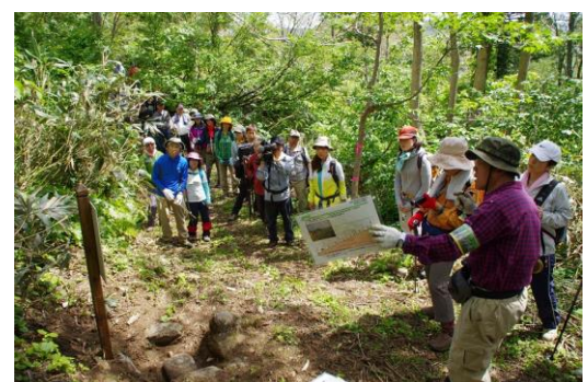
▲増毛山道に遺された 100年前の1等水準点をガイドする様子