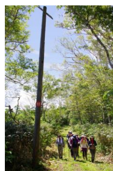
▲明治22年に設置された 電信線の電柱と増毛山道