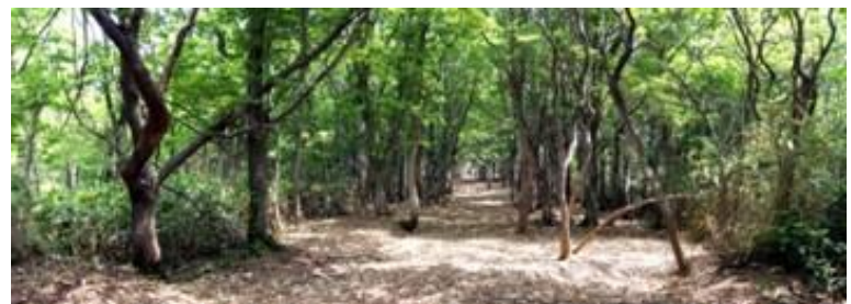
▲復元された増毛山道