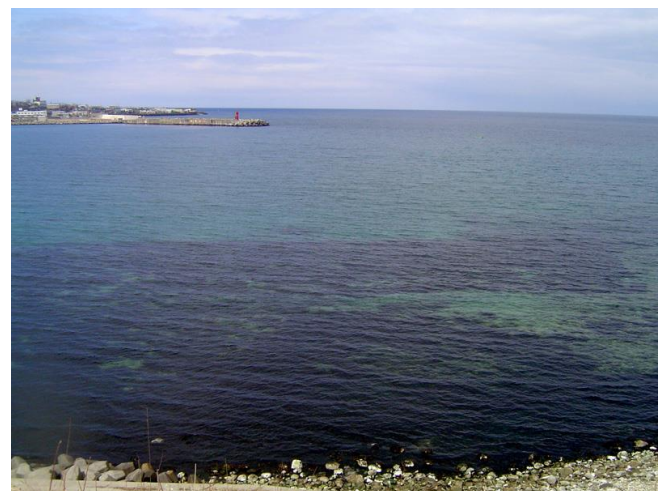
▲眼下に広がる復元された藻場