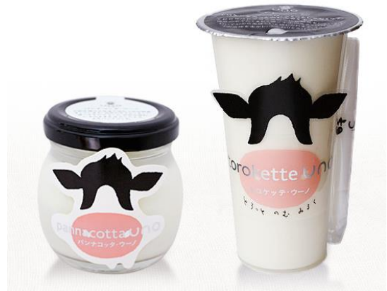
▲『パンナコッタ・ウーノ』(左)と『トロケッテ・ウーノ』(右)