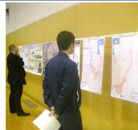
浸水想定区域図(想定最大規模)等のパネルを展示