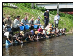
ヤマベ稚魚の放流