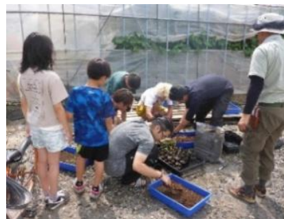
地域住民による湿性植物の育苗