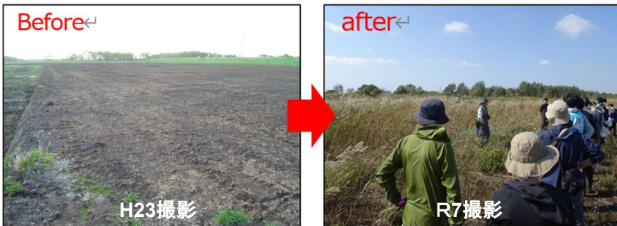
事業実施前後の幌向自然再生地の様子