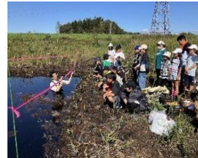
近隣小学校の地域学習