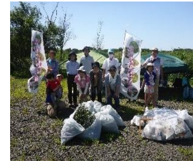
外来種駆除と堤防のゴミ拾いイベント