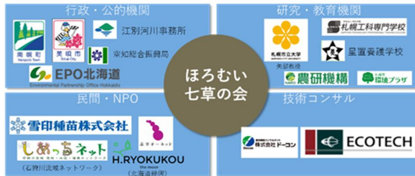
幌向地区自然再生の推進体制