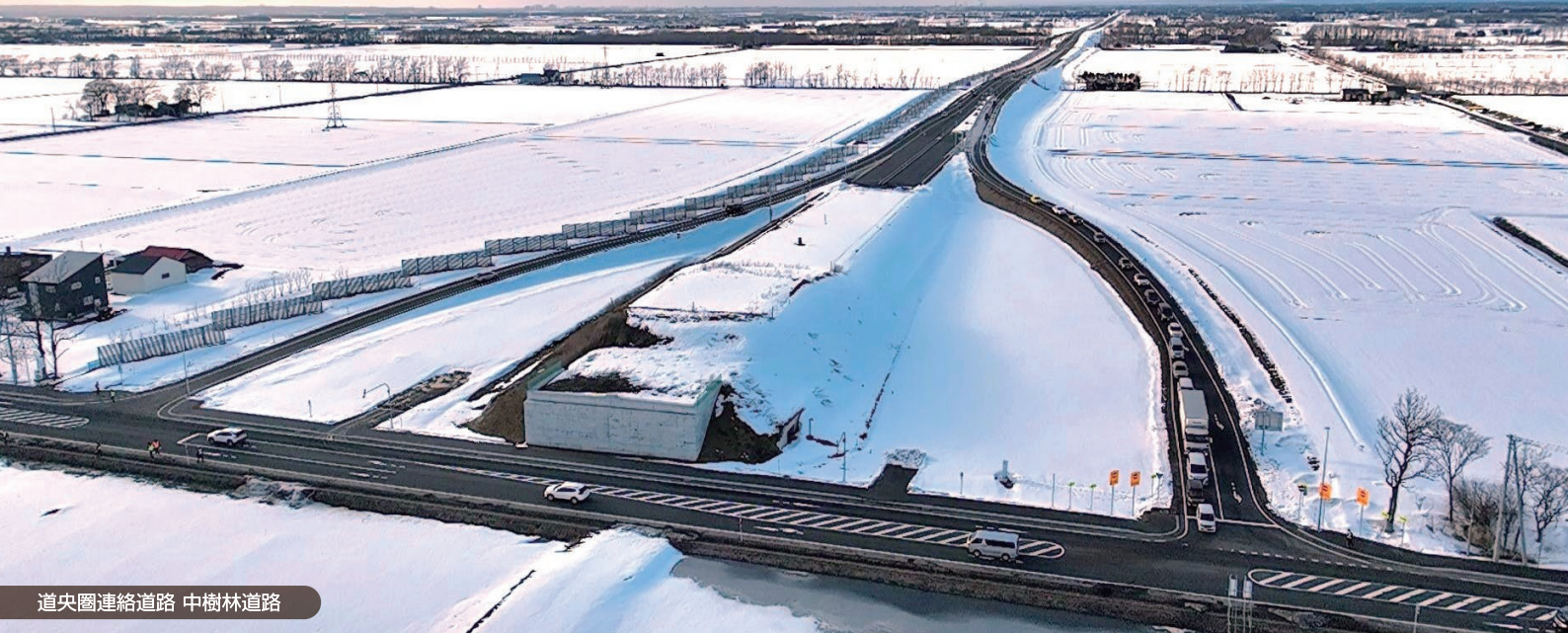
道央圏連絡道路 中樹林道路