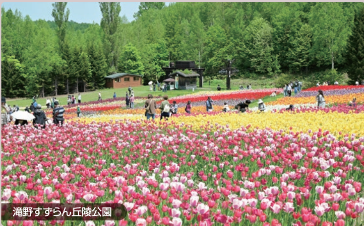
滝野すずらん丘陵公園