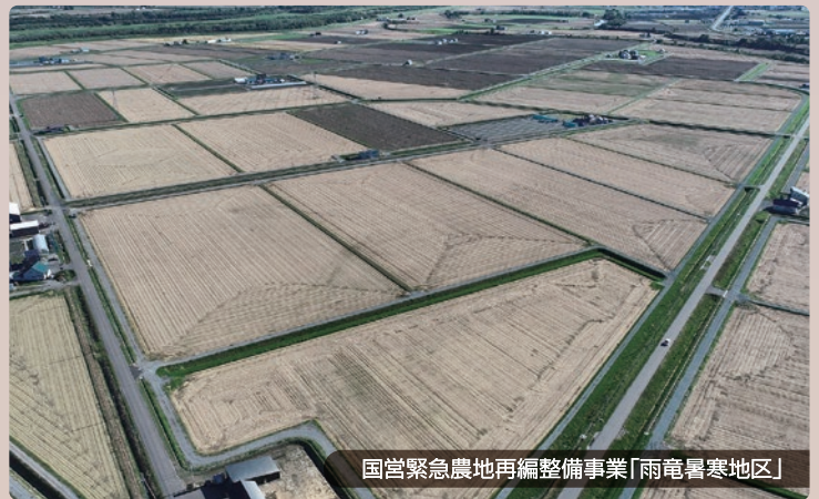
国営緊急農地再編整備事業「雨竜暑寒地区」