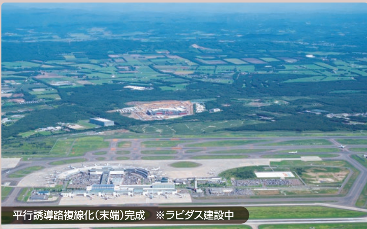
平行誘導路複線化(末端)完成 ※ラピダス建設中