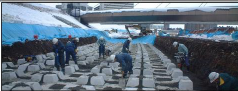
根固ブロックの敷設

普段は市民の憩いの場となる豊平川の高水敷も、洪水時には非常に速く大きな力を持った流れが発生するため、流れによって堤防や堤防の土台となっている地盤が削られ危険な状態になることがあります。そのため豊平川では図の様に堤防及び堤防に接する高水敷にコンクリートブロックを敷きつめて、もし強い流れが発生しても堤防が壊れることを防ぐための工事を進めています。写真は、堤防に接する高水敷に、根固めブロックという名称の大型コンクリートブロックを敷設している状況です。