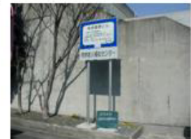
津波避難ビルとその標識